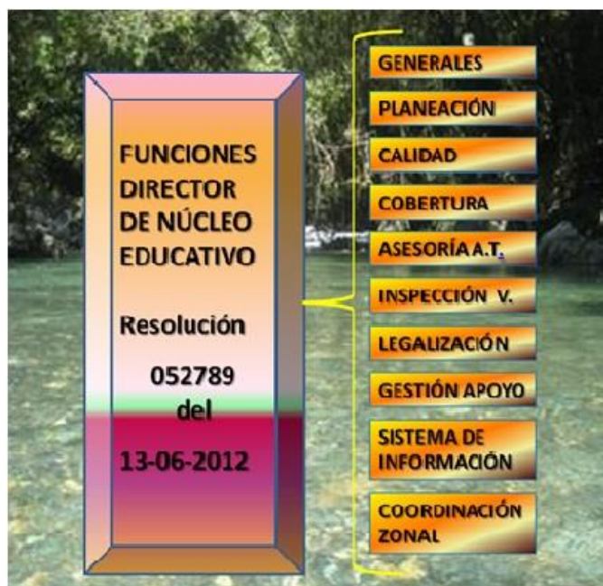
Grafica No. 2.

Establecimientos educativos del municipio de la Estrella: prestan el servicio educativo 26 establecimientos educativos, según reporte del Directorio Único de Establecimientos Educativos (DUE) del año 2014, de los cuales 4 son oficiales y 22 son no oficiales o privados, como se observa a continuación: