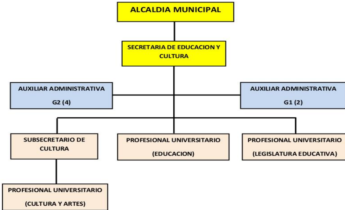
Grafica No. 1.

El Núcleo Educativo No. 913 del municipio de la Estrella está conformado por las instituciones y centros educativos oficiales y privados que ofrecen programas de educación formal de preescolar, básica primaria, básica secundaria y educación media, además, de las instituciones de educación para el trabajo y el desarrollo humano que prestan el servicio en su jurisdicción. El Decreto Nacional No. 4710 de 2008 establece que las entidades territoriales certificadas dispondrán de formas de coordinación tales como los actuales núcleos educativos y que la dirección de núcleo educativo tendrá funciones de coordinación y apoyo en la planeación, seguimiento y evaluación de los procesos propios de los establecimientos educativos de su jurisdicción.